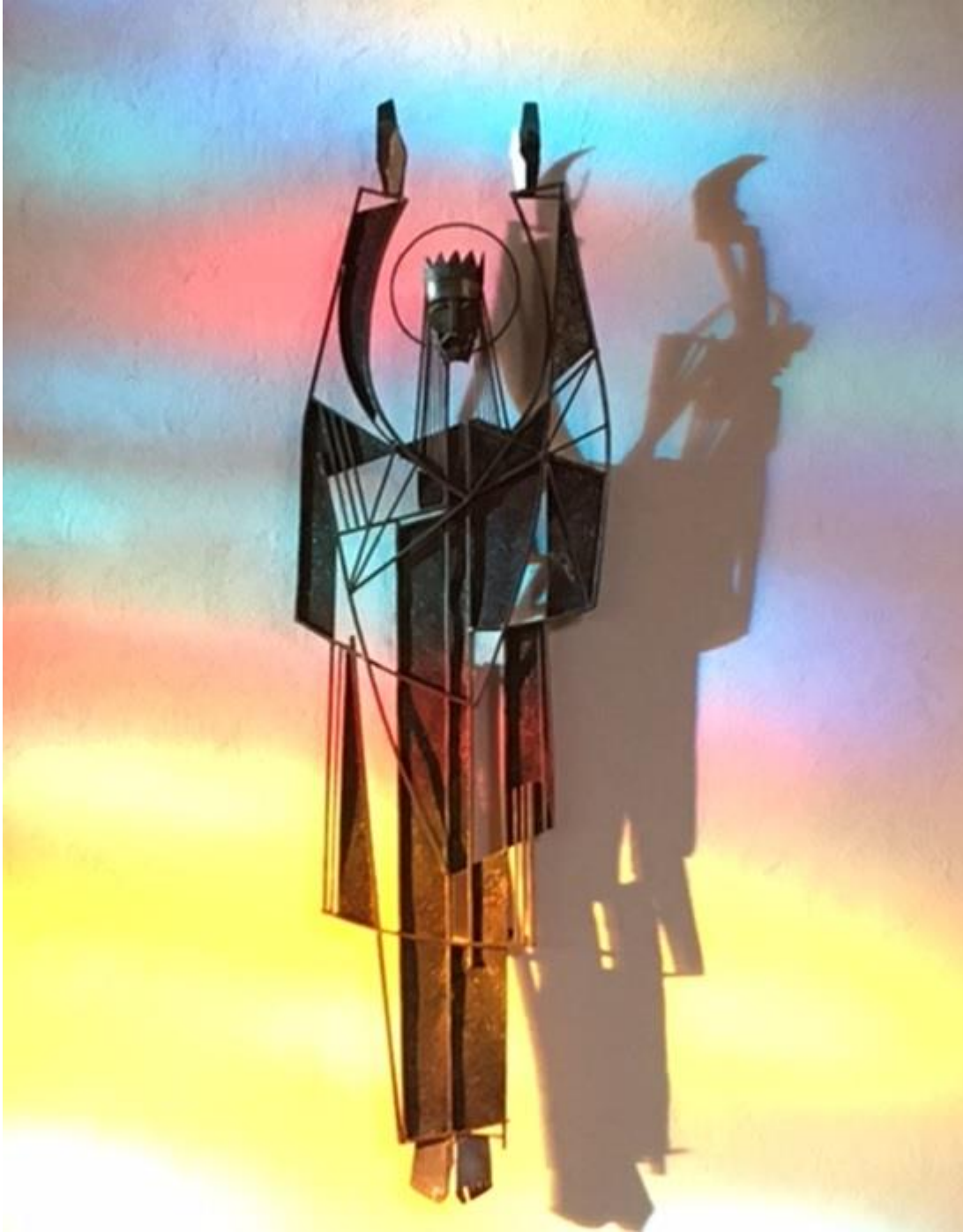
Le Christ-Roi de la Cathédrale, Œuvre de Claude Théberge, photo abbé Chester Cotton