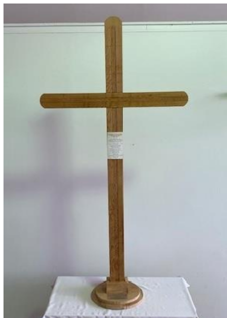
Croix pèlerine du 100 ème anniversaire