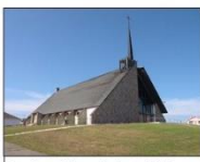
Paroisse d'Havre-Aubert, 1793 (230 ans)