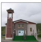
Paroisse de Murdochville, 1953 (70 ans)