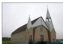
Paroisse de Saint-Jogues, 1954 (70 ans)