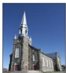
Paroisse de Cap-Chat, 1864 (160 ans)