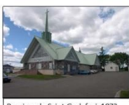
Paroisse de Saint-Godefroi, 1873 (150 ans)