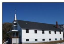
Paroisse de Gros-Morne, 1963 (60 ans)